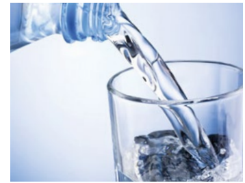
— Aigua potable