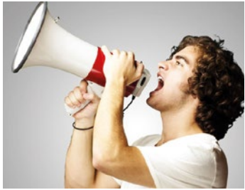
— Llibertat d'expressió