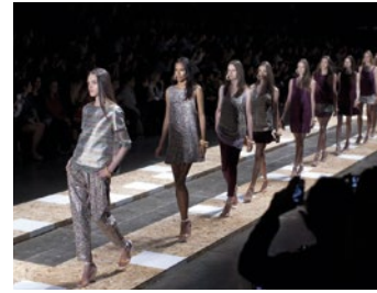
— Roba de moda