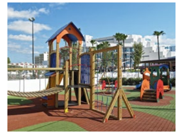
— Espais per a jugar