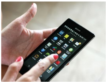
— Mòbils i Smartphones